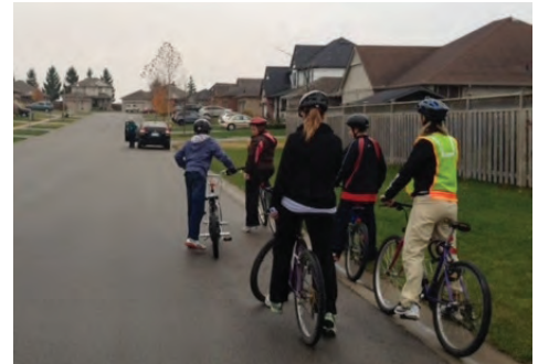
Tour à vélo de St. Thomas

Les écoles de Kitchener et de Woodstock viennent elles aussi de lancer leur projet. Elles ont demandé aux élèves de rapporter un sondage à leur famille, et sont en train de former un comité regroupant des élèves, des enseignants et des parents dévoués. Les trajets qu'empruntent les élèves feront l'objet d'une évaluation, en hiver si le temps le permet, ou au début du printemps.