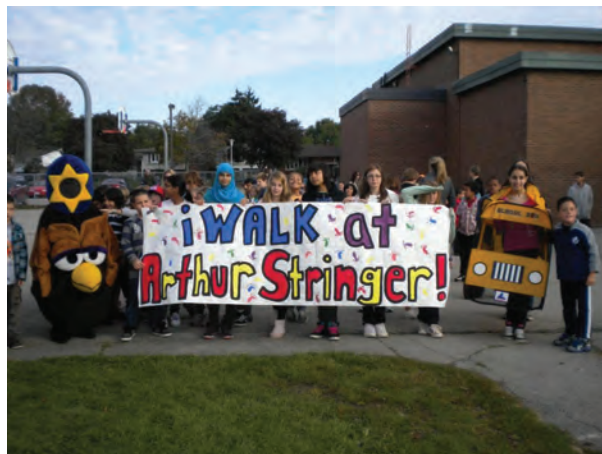
École publique Arthur Stringer, pendant la JIME de London

Le forum et l'atelier subséquent correspondent parfaitement aux priorités stratégiques du HCP de London—santé mentale et activité physique—et viennent s'ajouter aux autres initiatives locales comme les programmes Écoliers actifs et en sécurité (EAS) et Strengthening Neighbourhoods, ainsi qu'au sommet Share the Road, qui s'est récemment déroulé à London. La présentation de la planification du transport scolaire (PTS) dans le cadre d'un essai pilote EAS régional, appuyé par le programme EAS national de Green Communities, a eu un effet catalyseur et a permis de tirer parti des réussites antérieures.