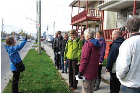
Vérification du potentiel piétonnier

Le forum s'est terminé sur l'animation, au niveau local, d'ateliers fondés sur la Charte internationale de la marche de la conférence Walk21, dans le but d'inciter les parties intéressées à passer à l'action. Le projet walkON est une excellente occasion d'apprentissage, tant pour les collectivités visées que pour l'équipe Le Canada marche. Nous sommes extrêmement reconnaissants envers les champions locaux et nos hôtes partout en Ontario qui se sont non seulement occupés de l'aspect logistique de nos visites, mais qui nous ont aussi nourris, logés et choyés !