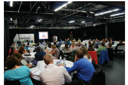
Tournée sur le potentiel piétonnier, à Red Deer (Alberta)

Chaque collectivité a commencé par remplir un questionnaire de base, fondé sur la Charte internationale de la marche ( http://www.walk21.com ). Les résultats ont fait l'objet d'un examen par cyberconférence, puis le calendrier des visites a été fixé pour chaque collectivité. Les visites, organisées conjointement par Le Canada marche, Walk21 et les AHS, consistaient en une séance petit-déjeuner avec les principaux décideurs de la collectivité, suivie d'une journée de formation pour les professionnels. Des vérifications du potentiel piétonnier, effectuées dans les rues de la collectivité, et des séances de formulation de vision avec les résidents, ont permis de cerner les besoins de ces derniers en matière d'infrastructure piétonne. Les résultats des ateliers sur le potentiel piétonnier seront affichés en février, sous forme d'études de cas, à http://www.canadawalks.ca (en anglais). Grâce aux leçons tirées de la tournée pilote, les AHS pourront explorer les possibilités d'étendre le programme à toute l'Alberta.