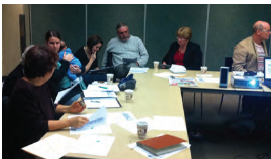
Forum de London

Par Diane Szoller, Thames Region Ecological Association et Gail McMahon, London Block Parents Association