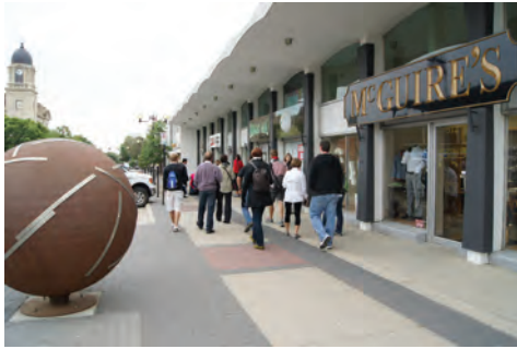
Vérification du potentiel piétonnier des rues de Lethbridge (Alberta)