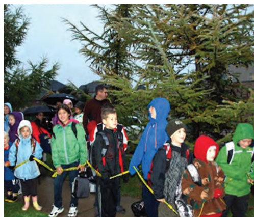
Les élèves arrivent à l'école en Pédibus